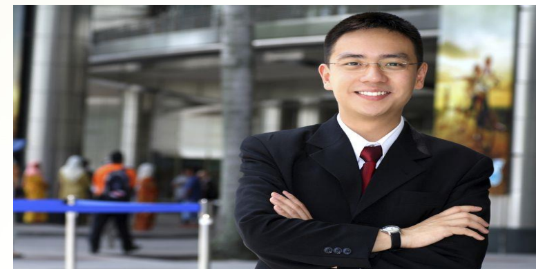
專業及工商業支援服務業